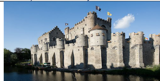
Gent– Impozantna tvrđava Gravensten