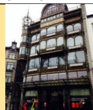
“Old England” muzej