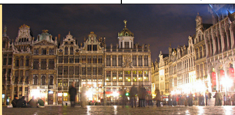
Brisel: Gran-Plas uveče ;