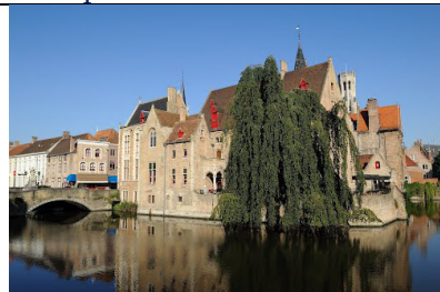
Detalj iz čarobnog starog Briža