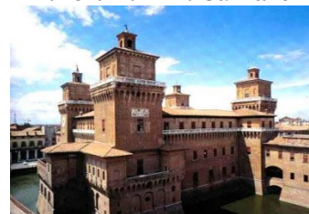
Ferara - Kastelo Estance