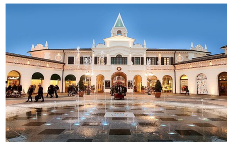
Outlet Noventa di Piave, detalj

ORGANITACIJA PREVOZA. Prevoz se organizuje modernim turističkim autobusima sa punom opremom. Potpisivanjem ugovora putnik je dužan da prihvati mesto u autobusu koje mu dodeli agencija. Postoji mogućnost transfera punika iz mesta na pravcu od Niša ili Zaječara/Bora do Jagodine za minimum 6 putnika po pravcu uz doplatu od 20 € po putniku – povratna karta. Agencija pravi raspored sedenja, uzimajući u obzir vreme uplate, zatim starosne godine putnika i lica slabo pokretna, porodice sa malom decom i trudnice. Naknadne izmene nisu moguće. Ukoliko putnik želi rezervaciju određenog sedišta može je izvršiti prilikom rezervacije aranžmana, uz doplatu po osobi i to: za II i III red – 20 €; za IV i V red -15 €; dva spojena sedišta (pod uslovom da ima mogućnosti) i to pocev od VI reda: 60 € po osobi. Za želje sedenja levo ili desno u odnosu na pravac kretanja, do prolaza ili prozora i sl., agencija ce se truditi da izađe u susret putnicima uvek kada je u mogućnosti bez ikakve nadoknade.