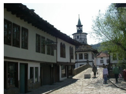
Stara Trjavna, jedne od tipičnih ulica

Trjavna (Тръвна), istorijski grad do koga se stiže dolinom istoimene reke. Ovaj grad karakterističnog po neverovatno dobro očuvanoj arhitekturi kuća, celih ulica, trgova i četvrti grada iz perioda Bugarskog narodnog preporoda u 18. i 19. veku za vreme turske okupacije, kada će se bugarsko društvo reformisati i grad postati bogat i veoma uspešan u razvoju zanatstva i trgovini, pre svega, proizvoda od tekstila, drveta i kože. U prizemlju, kuće (isključivo bele boje), su obično nepravilnog oblika i tu su smeštene zanatlije, trgovci i magaze, ugostitelji... Gornjim spratovima dominiraju drveni lučni ili visoki pravougaoni prozori, a njihov broj, ukazivao je na bogastvo vlasnika. Krovovi su pokriveni dobro uređenim kamenim pločama. Ovaj grad sa ponosi sa preko 140 kulturnih spomenika, muzeja i izložbi...Ukupno 80 km u oba smera, trajanje izleta oko 5 sati.