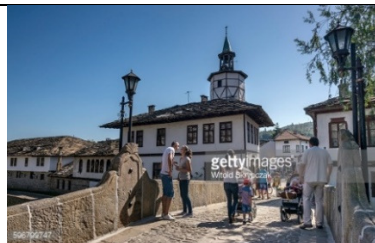
Trjavna – Stari most i sahat kula