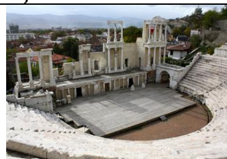
Plovdiv-ostaci antičkog odeona