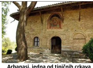
Arbanasi, jedna od tipičnih crkava