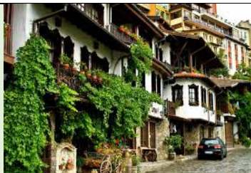
i detalj iz centra grada