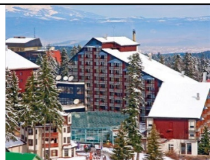
Rila-Ski centar Borovec