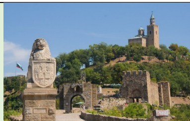
Veliko Trnovo – zamak Carevec