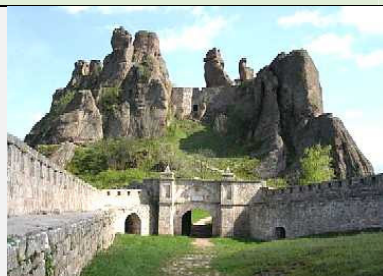
Belogradčik tvrđava –Kalet